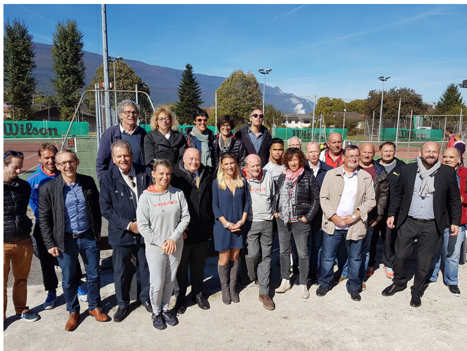
Photo de famille du Tennis savoyard avec le Président Et les clubs, dirigeants et nos conseillers.