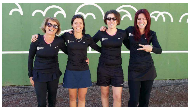
L'équipe du TC BARBERAZ finaliste à Annecy

Les phases de clubs, départementales et régionales, ont permis aux clubs victorieux de se qualifier pour la phase finale.